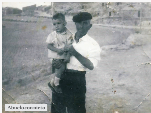
Abuelo con nieto

El recorrido vital de todos los habitantes de Las Pedrosas estaba marcado por una serie de hitos, en los que la religión tenía un papel importante. Desde el nacimiento con el inmediato bautizo, la primera comunión como ingreso definitivo en la comunidad, el matrimonio con la formalización del hogar familiar como núcleo elemental de la sociedad, y finalmente con la muerte como hecho social en el que se estrechaban los lazos solidarios de la comunidad.